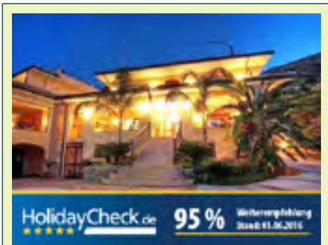
Hotel Cannamele Resort Tropea

Zu den schönsten Anblicken in ganz Kalabrien gehört die Costa Viola, deren felsige Küstenlandschaften direkt an das türkisblaue Meer des Tyrrhenischen Meeres grenzen. Der Tag beginnt mit einer Fahrt entlang der Küste des Tyrrhenischen Meeres in Richtung Süden, wo nach etwa 1,5 Stunden Fahrt der Ausgangspunkt der heutigen Wanderung liegt. Für ein besonderes Panorama auf dem Weg sorgen die Meeresstraße von Messina sowie das idyllische Fischerdorf Scilla mit seiner markanten Klippe und dem historischen Castello Ruffo di Scilla. Zu-