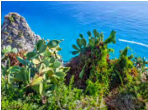
Beeindruckende Ausblicke auf das Mittelmeer

Lernen Sie die Natur Kalabriens hautnah kennen!