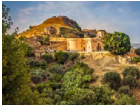
Unberührte Landschaften im Hinterland