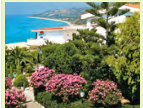
Ausblick vom Hotel Santa Lucia