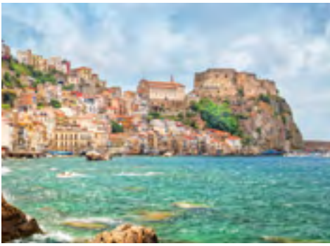
Castello Ruffo di Scilla

samen Weilern und einem regionalen Naturreiservat, das ganz von der kalabrischen Tier- und Pflanzenwelt vereinnahmt ist. Zum Abschluss der Wanderung erreichen Sie das berühmte Kartäuserkloster Certosa di San Bruno, das im 11. Jahrhundert errichtet wurde und in dem noch heute die eremitischen Mönche leben, die sich einem schweigsamen Leben gewidmet haben. Auf einem geführten Rundgang bietet sich ein Einblick in das historische Gemäuer und mit ein wenig Glück werden Sie Zeuge der gregorianischen Gesänge der Mönche. Mit diesen Eindrücken endet die Wanderung, gegen Abend geht es in das Hotel zurück.