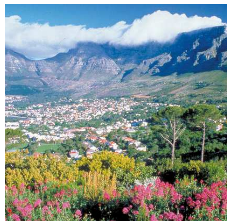
Kapstadt - Tafelberg