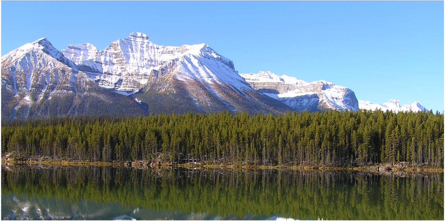
Rocky Mountains, Kanada