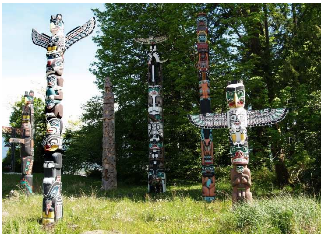
Stanley Park, Kanada