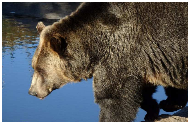
Grizzly Bär, Kanada